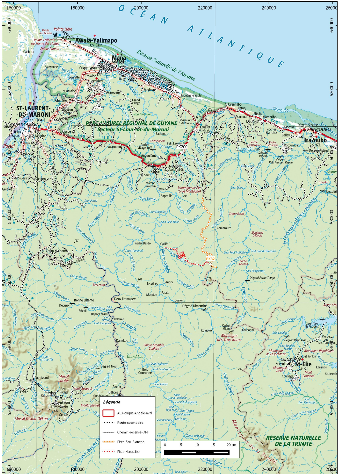
Schéma de pénétration du domaine forestier dans le cadre de l'AEX « crique Angèle aval » de la SARL PMJ sur un fond de carte IGN au 1/500 000 e en RGFG95 UTM22